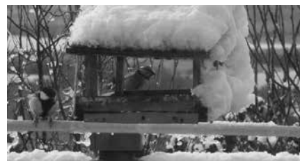
5. Bent kékcinke, kint széncinege