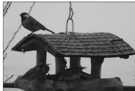
1. Széncinke őrsebben, lent kékcinke.