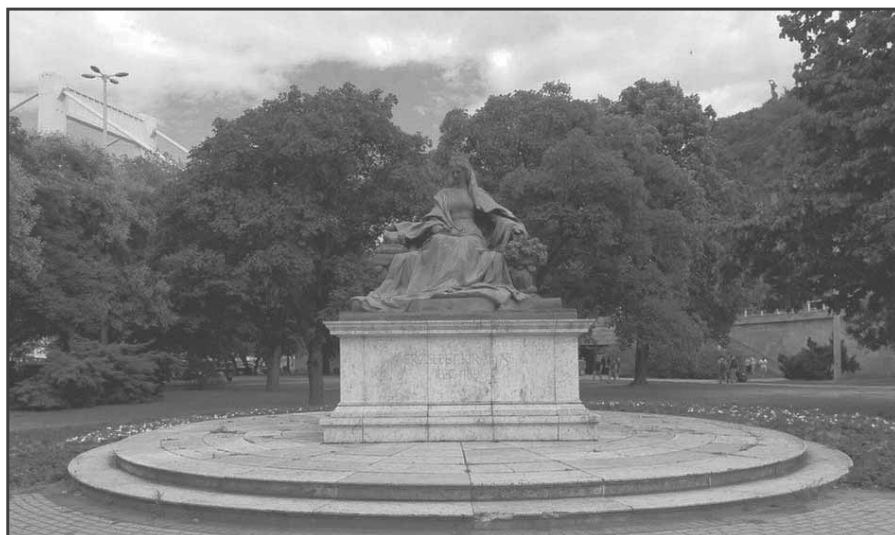
Zala György szobrász Erzsébet Királyné emlékműve ma a Döbrentei téren az Erzsébet Híd budai hídfőjénél

Az emlékmű 1953-ig (egyek források szerint 1947-ig) állt a helyén. Ekkor eltávolították, majd évtizedekig a süllyadási és a kiscelli raktárakban őrizték, szerencsére Zala György aranyozott bronzból készült szobrát nem olvasztották be. 1986 telén az eredeti helyszínnel szemben, az Erzsébet híd budai hídfőjénél, a Döbrentei téren állították fel újra Erzsébet királyné szobrát, de már az eredeti alkotás fölé helyezett architektonikus rész, a kupolás csarnok nélkül.