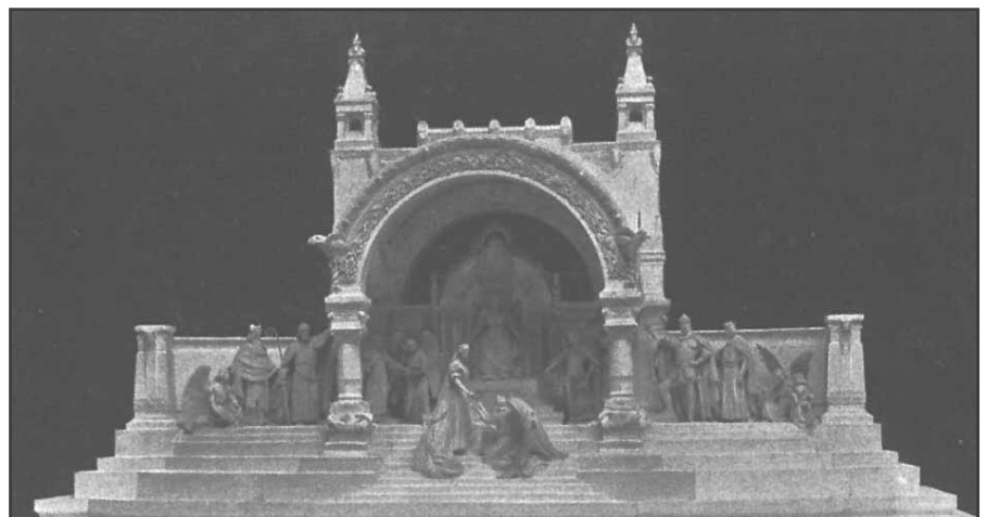
Fadrusz János terve

A királynak nem tetszett a mű és az sohasem készült el. Ferenc József életében, a pályázatok sorát utasította el, igazán egyik